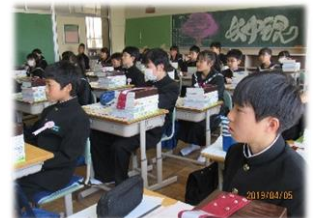
新しい学級、教科書