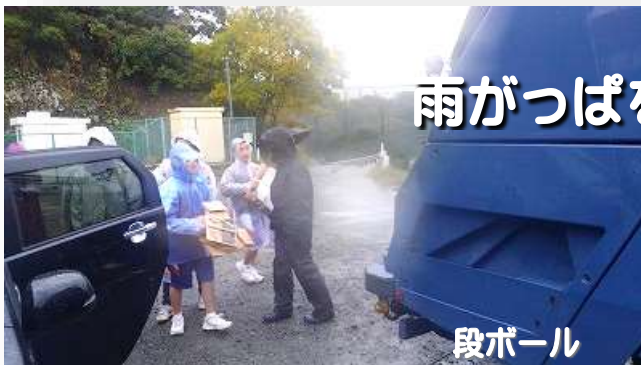
雨がっぱを着ての作業

地域の皆様、地区から回収作業を行っていただいたPTAの皆様、PTA役員の皆様、そして参加してくれた生徒たち、雨天の中の作業をしていただきまして、本当にありがとうございました。心より御礼申し上げます。