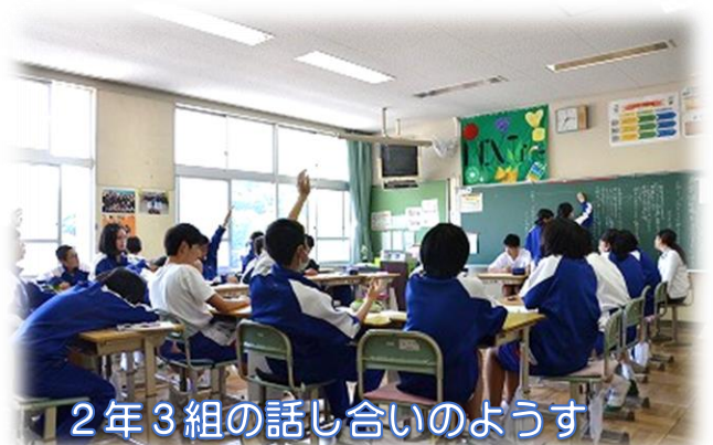
2年3組の話し合いのようす