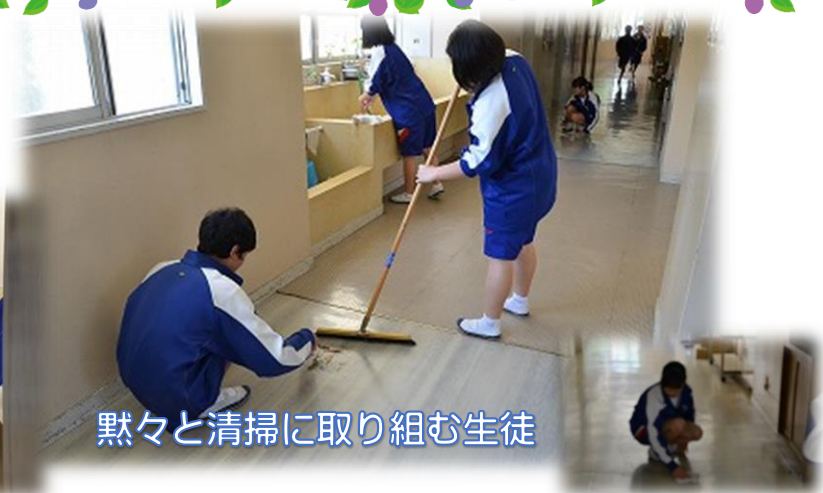
黙々と清掃に取り組む生徒

クラスの話し合いでは、多くのクラスで「黙働清掃をちゃんとしよう。」という意見がありました。さて、職員室前廊下や印刷室が分担の3年1組の班の生徒は、毎日黙々と掃除に取り組んでいます。床を掃く生徒も、雑巾がけをする生徒も、せっせと行います。担当の先生が出張等でいなくても、自分たちで責任をもって取り組む姿勢は変わりません。校舎もきれいになります。掃除をしている生徒もすっきりとした気持ちになっていることと思います。他にも黙々と掃除に取り組んでいる班があると思います。このような姿勢が全校に広まると、まさに田方一の学校にふさわしい光景となっていきます。