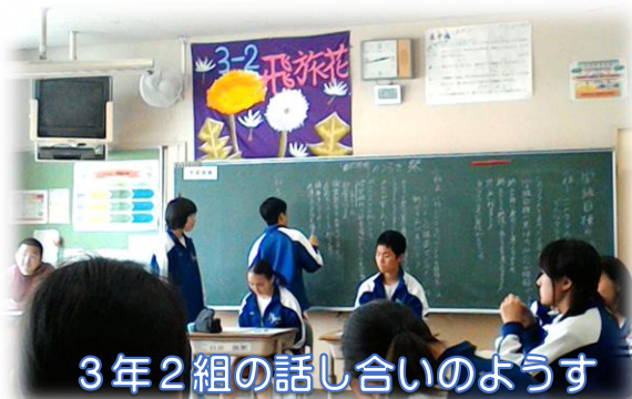
3年2組の話し合いのようす

平成29年度の生徒会として、「田方一の学校」を目指しています。6月8日の生徒総会ではそれについて話し合います。この話し合いに向けて、学級では「学級目標を達成するために」、学年では「学年目標を達成するために」または「学年行事を成功させるために」という議題で