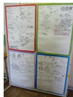
各色のメッセージ掲示板

本日、体育の部の実施についてのお知らせのプリントを配布しました。確認をお願いいたします。天候が不安定ですので、延期や日程の変更が考えられます。マメールでの連絡もありますので、確認及び対応をよろしくをお願いいたします。