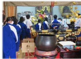
<1年生:北条寺(南江間)>