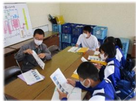
<1年生:清掃センター(長岡)>