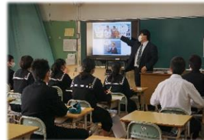
<3年生:私立高校説明会>