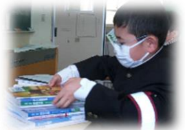
新しい学級、教科書

生徒会メンバーは新しい形での生徒総会、かつらぎ祭に挑戦しようといういろいろ検討中です！